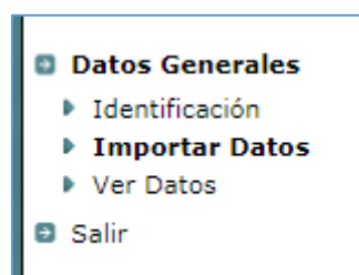
Figura 3 – Menú importar datos

En Alborán, esta opción está disponible en el menú “Importar Datos”: