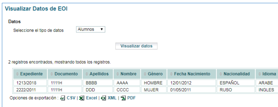
Figura 9 – Resultados

Pulsando el botón “Visualizar Datos” se muestra en formato de tabla la opción deseada.